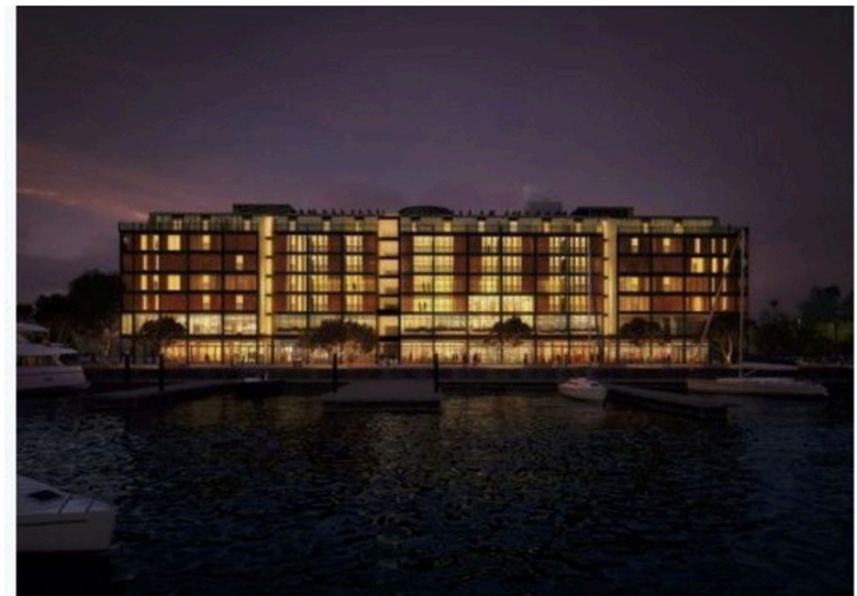
奥克兰柏悦酒店效果图，凭借滨水优势客人可通过游艇直接抵达酒店。