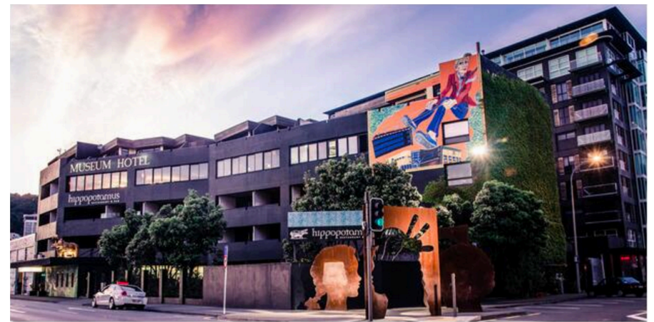
Overseas buyers spent $1.01 billion in six months on commercial properties in New Zealand.